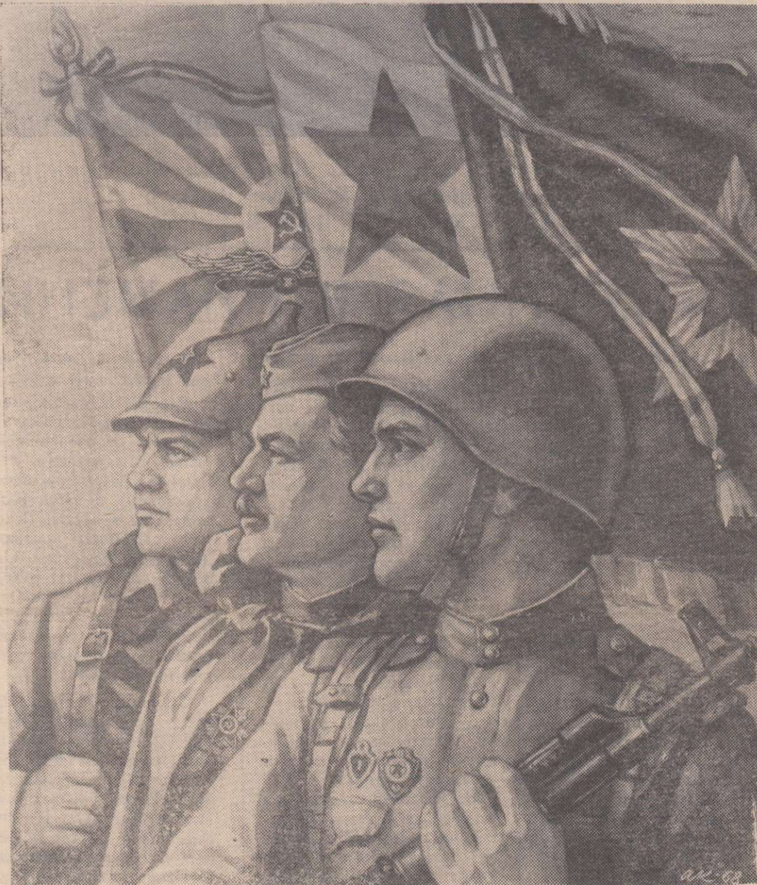
ПЛАКАТ ХУДОЖНИКА Ал. КРУЧИНЫ.