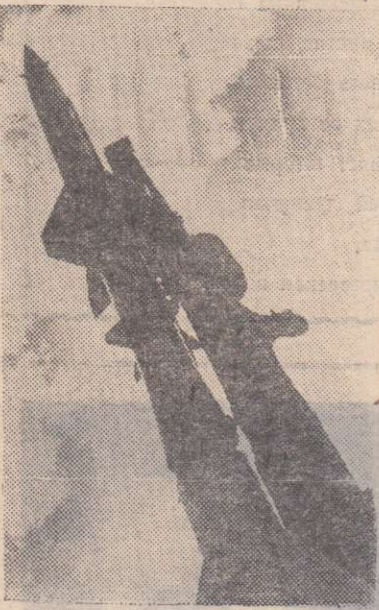
Зенитная ракета на стартовой позиции.